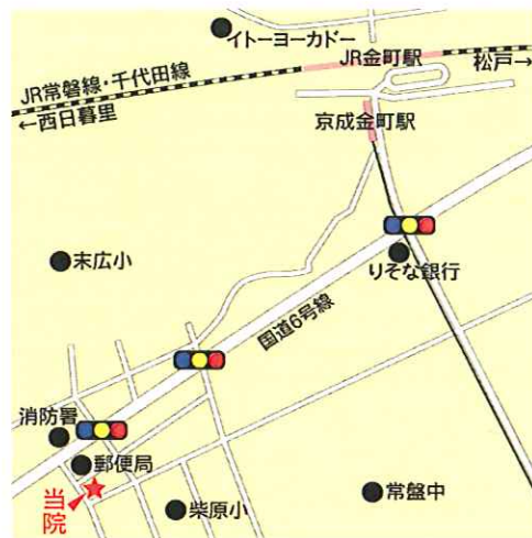
JR 常磐線/千代田線 金町駅 京成線 京成金町駅 徒歩12分